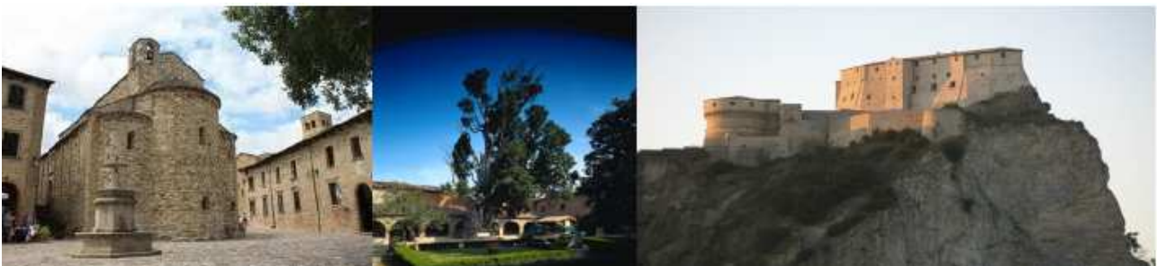
The Treasures of Faith in the footsteps of St. Francis between Landscape and Heritage of Valmarecchia. Fieldwork along the Marecchia Valley

09:00- 18:00 Post Final Workshop Excursion